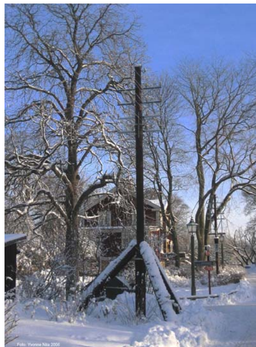
Stolplinjenätet på Skansen

OBS! Du har väl inte glömt att betala medlemsavgiften.